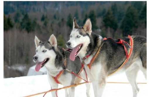
Jubiläumsveranstaltung 40 Jahre Schlittenhunderennen in Todtmoos